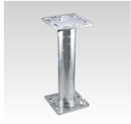
MPT 240x240 + 240x240, D 114,3