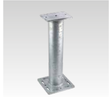
MPT 240x240 + 200x140, D 114,3