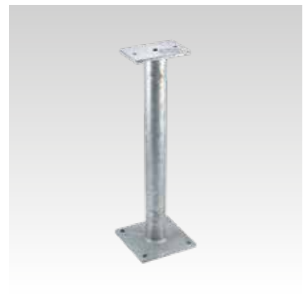
180x180 + 100x160, D 60,3