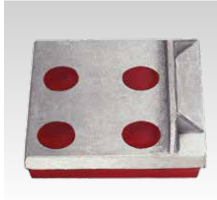
Con tope lateral