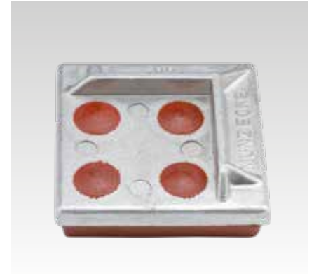
Con tope angular