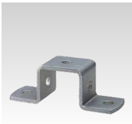
Para perfil 28/30 y 38/40