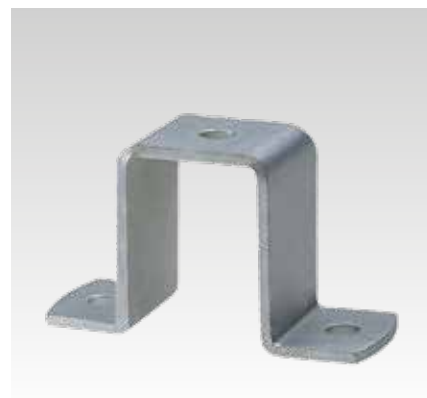
Para perfil 40/60