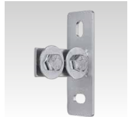
MPC-Soporte de carril soldado, horizontal