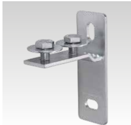
MPC-Soporte de carril soldado, vertical