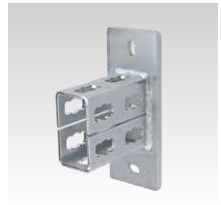
MPR-Apoyos de carril tipo S+ para perfil 41/82 y 41/124