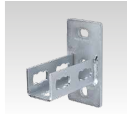
MPR-Apoyos de carril tipo S+ para perfil 41/41 y 41/62