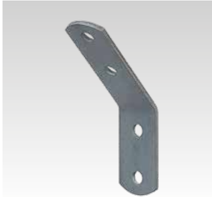
Escuadra de montaje 45°