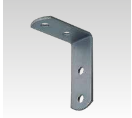
Escuadras de montaje 90°