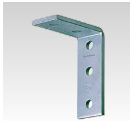
Escuadra de montaje 90°