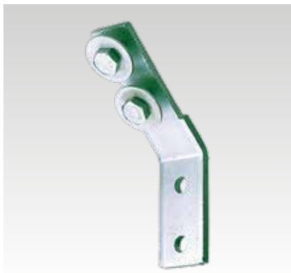
Escuadra de montaje 45°