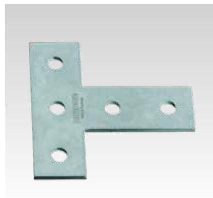
Placa T de conexión