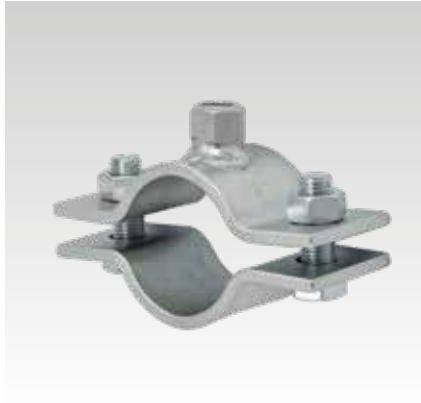
Abrazadera de punto fijo 60 x 6