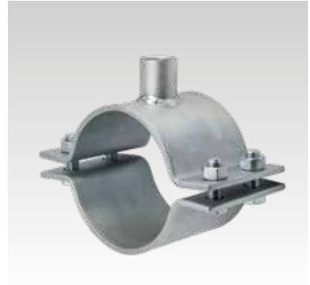
Abrazadera de punto fijo 120 x 6