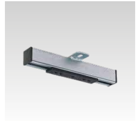
Soporte deslizante M10