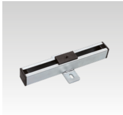
Soporte deslizante M8