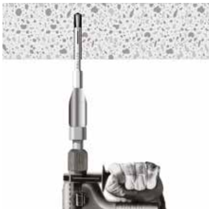
Introducir el anclaje MPC.

Taladre hasta el par de apriete. Limpie el agujero.