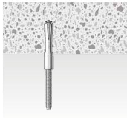
Roscar la varilla.

Taladre con la broca y el útil hasta que se alinee con la superficie. Los anclajes deben ir bien fijados al hormigón.