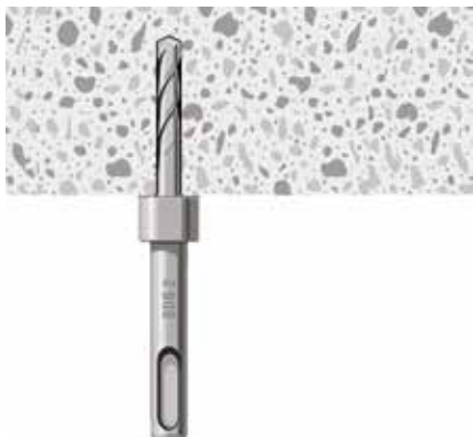
Taladrar con la broca MPC.

Taladre hasta el par de apriete. Limpie el agujero.