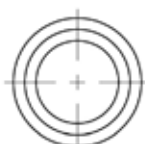
Antes de ajustar