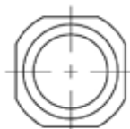
Después de ajustar